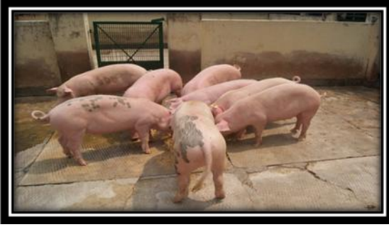
लैंडली: एक संकर प्रजाति सूकर

इस प्रजाति के विकसित विविध प्रकार के सूकरों को सभी प्रकार की स्थितियों में पाला जा सकता है। इन्हें कम खाद्य लागत के संसाधनों के साथ खिलाया जा सकता है। इनकी वृद्धि भी अच्छी रहती है और इनके बच्चों का आकार भी सामान्य रह सकता है। इसलिए इनका उपयोग घर के पिछवाड़े सूकर पालन उद्योग की छोटी इकाईयों जिसमें लगभग 5-20 सूकरों तथा साथ ही साथ बड़ी वाणिज्यिक इकाईयों के रूप में भी किया जा सकता है।